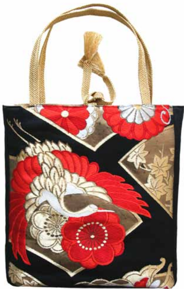
----- Tote-Bag „Sayoko“ Obi aus Seidenbrokat