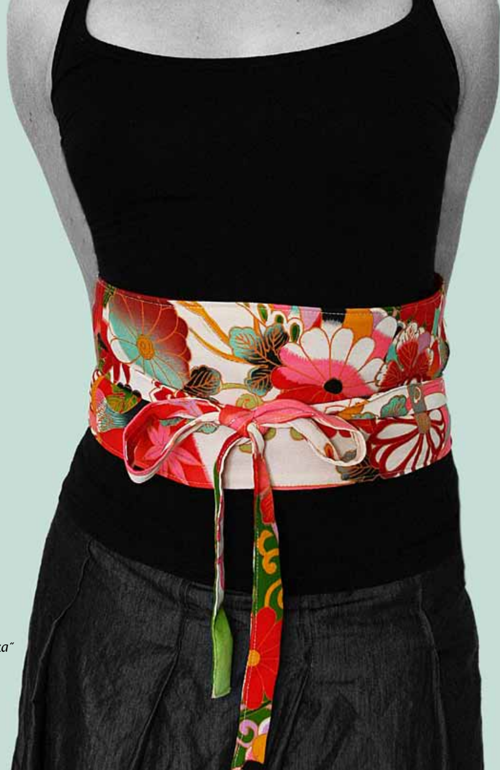
----- Wickelgürtel „Yuuka“ Kimonoseide