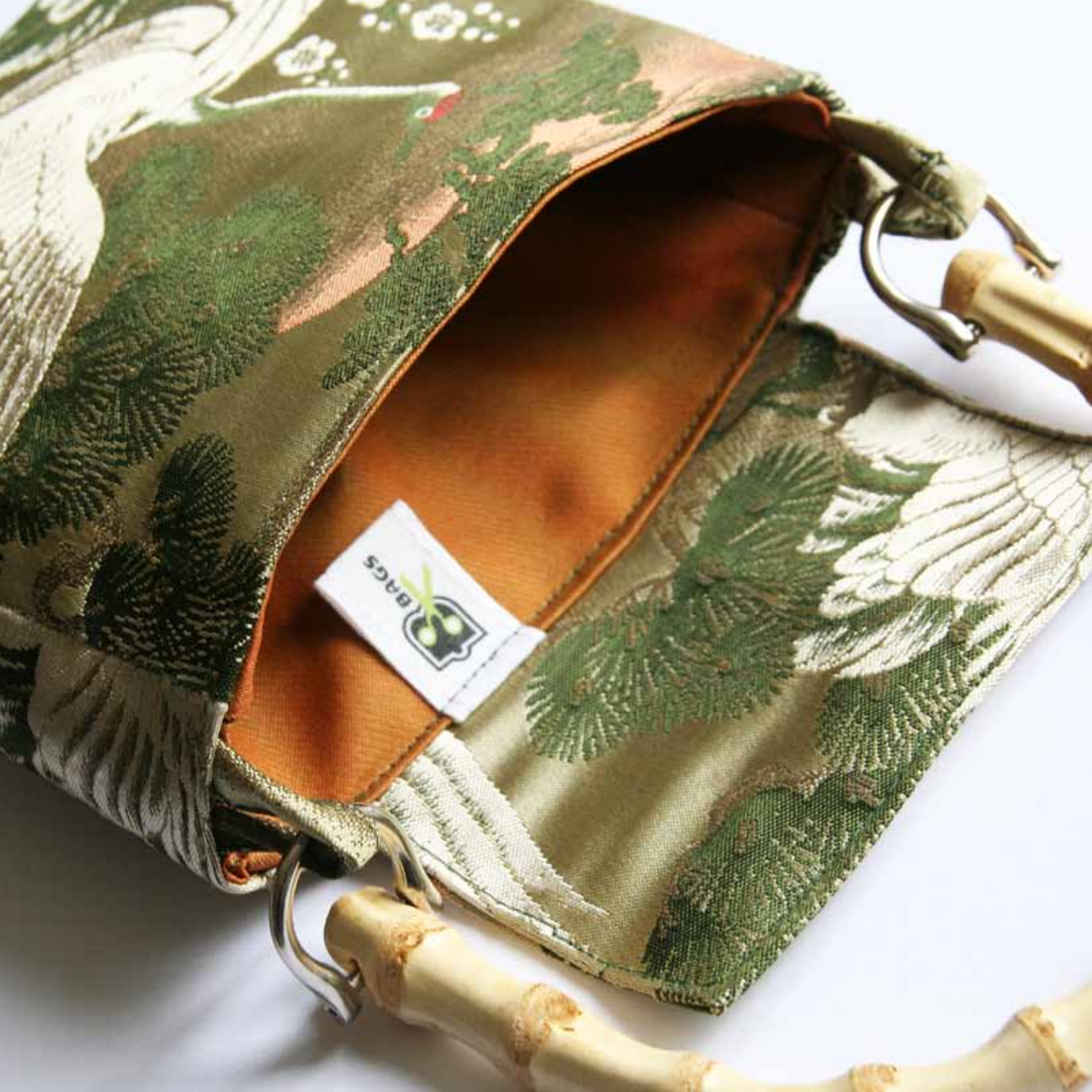
----- Täschchen „Moriko“ Hanhaba-Obi aus Seidenbrokat