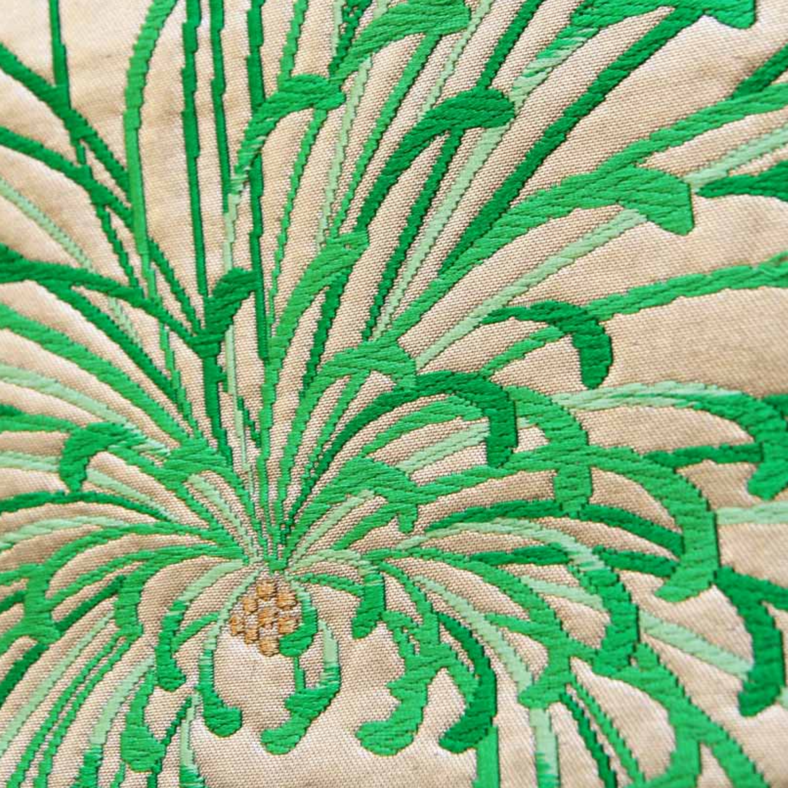
Tasche „Moe“ Obi aus Seidenbrokat