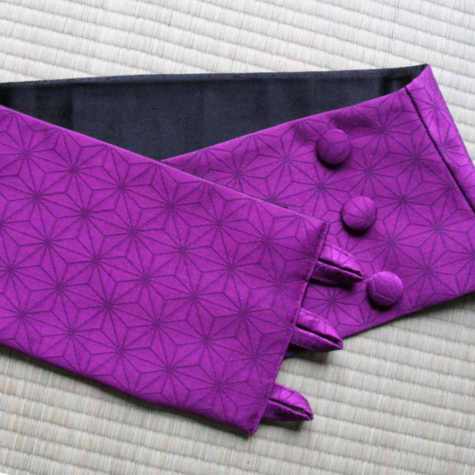
----- Hüftgürtel „Asuka“ Hanhaba-Obi aus Seidenbrokat