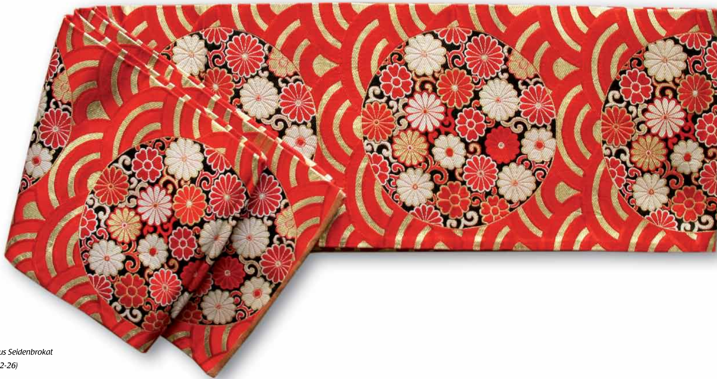
----- Hanhaba-Obi aus Seidenbrokat Taisho-Zeit (1912-26)