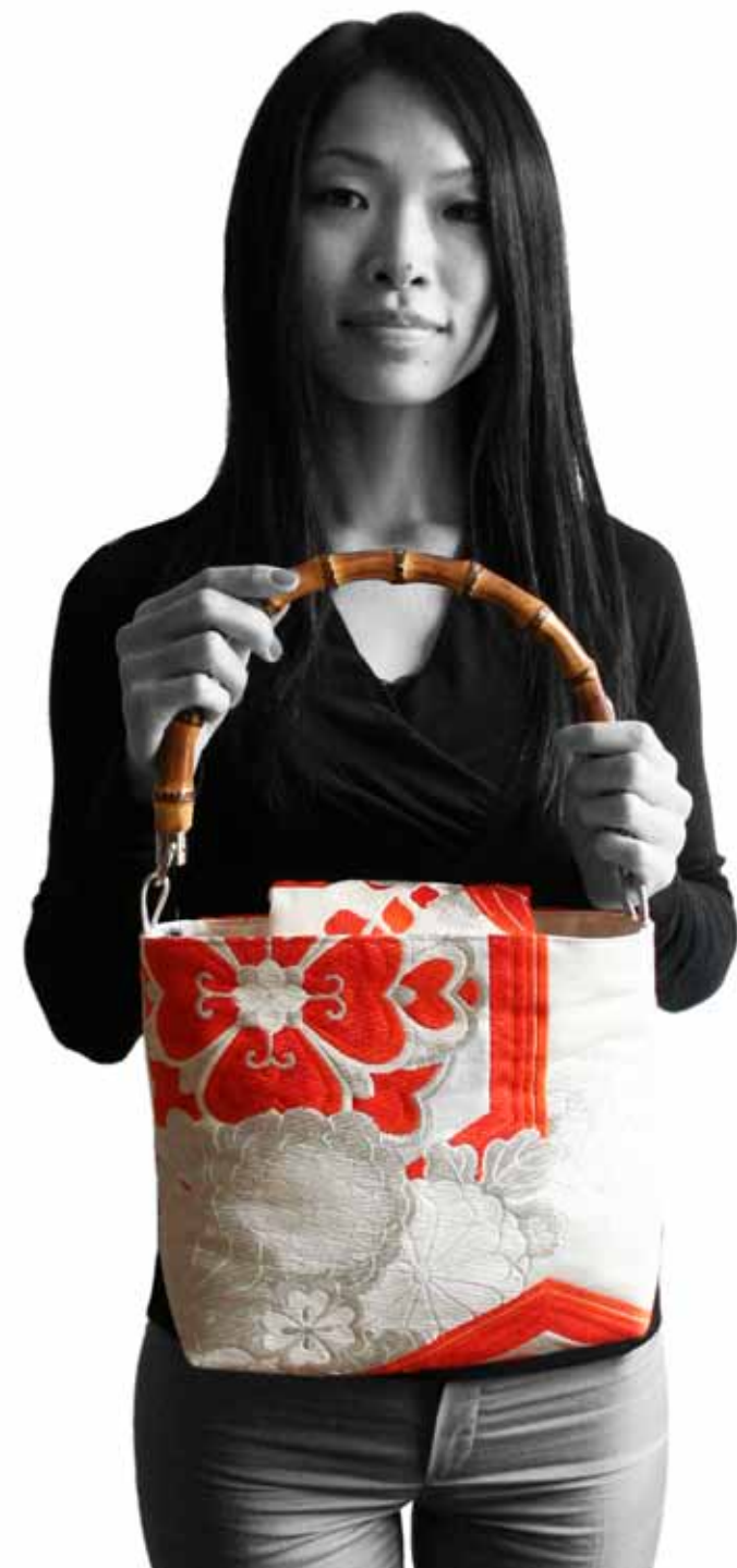
----- Tasche „Ayano“ Obi aus Seidenbrokat