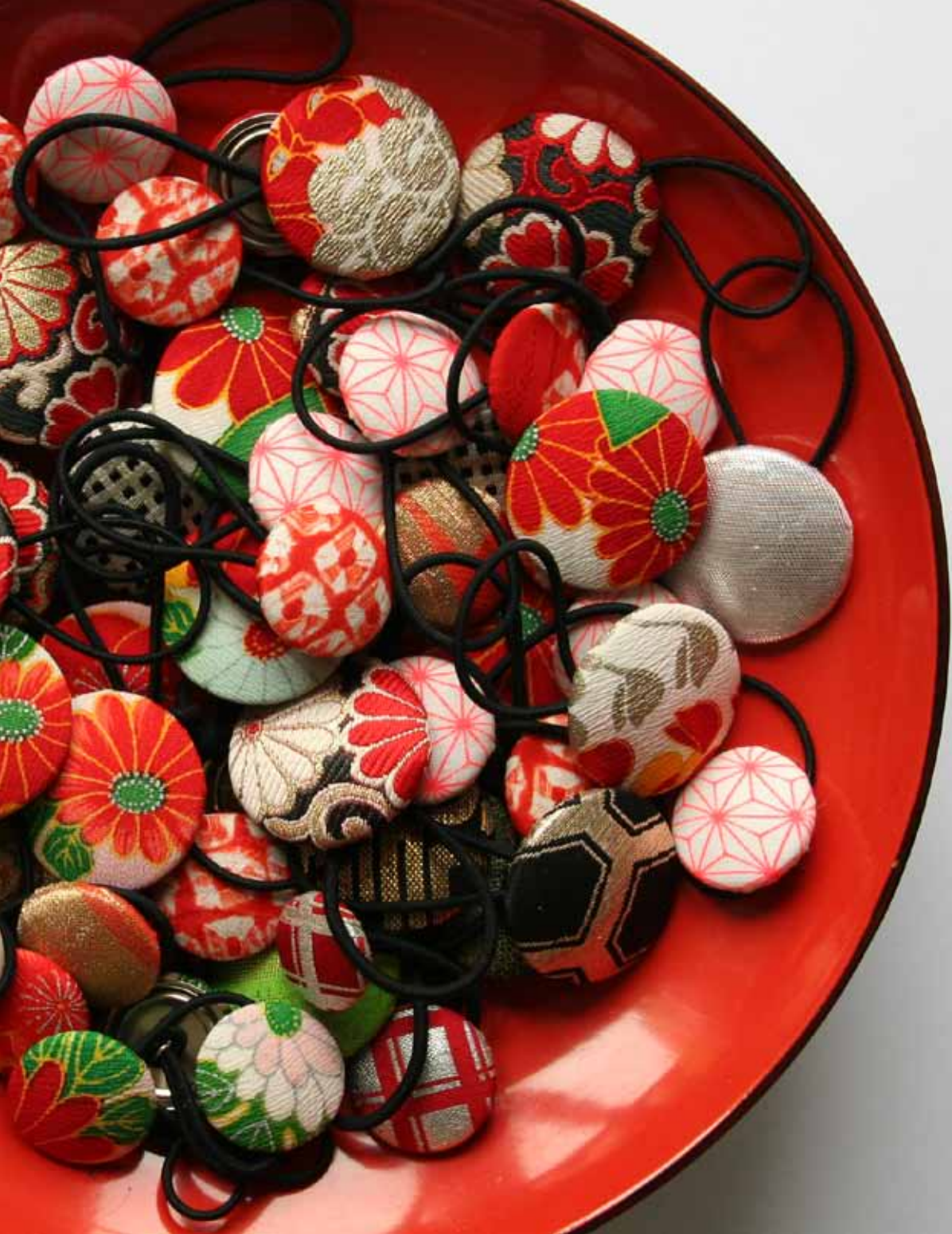
----- Zopfummis mit Seidenbrokat oder Kimonoseide bezogen